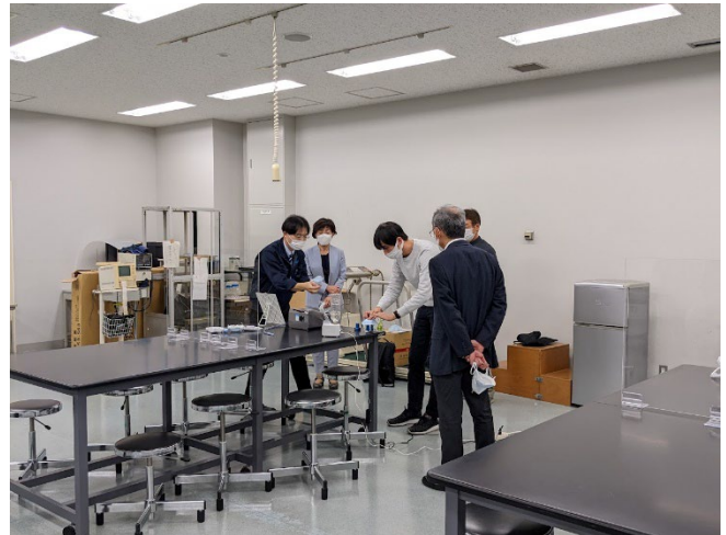
測定器メーカーによる演習