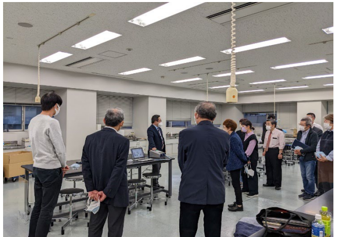
測定器メーカーによるデモンストレーション