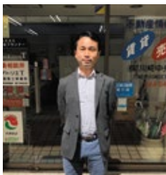
(令和2年度後継者育成講座) 株式会社川崎中央プランナー

川崎で不動産・介護事業を創業して30年。令和2年に父から事業承継した直後に、タイミング良く講座を紹介頂き受講しました。講座は経営や事業承継のことを基本から総合的に学べ、また質問にも講師に丁寧に答え頂き、勉強になりました。グループワークでは、受講者仲間の異なる視点でのご意見も聞けて参考になりました。経営サイドの方、特に2代目という同じ境遇の方とお会いする機会は限られるため、心の支えとなっています。講座終了後もオンライン勉強会や飲み会などを開催し、とても良い関係が続いています。「企業経営側の仕事に就く人は少なく、それをチャンスと考えて楽しんで欲しい」という講師の言葉にあったように、今後も会社の価値を高め続けることを楽しみたいと思います。