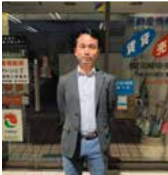
(令和2年度後継者育成講座) 株式会社川崎中央プランナー